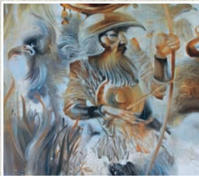
Охота степных волков. Холст, масло.