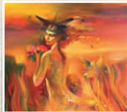
Муза степей. Холст, масло.