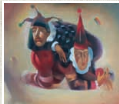
Взгляд с арены. Холст, масло.