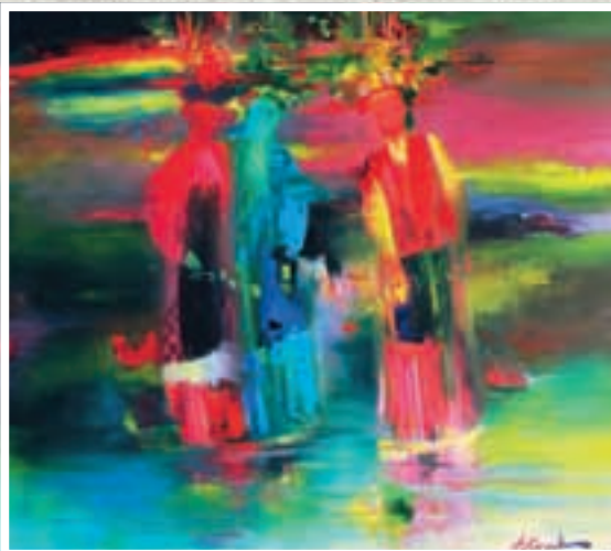
На Ивана Купала. Холст, масло.