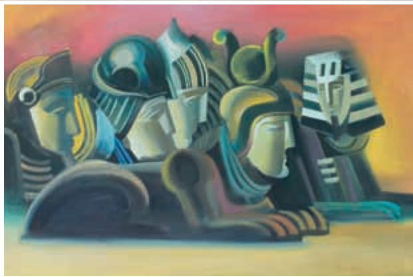
Зодиак познаний. Холст, масло.

Контактная информация: +38 050 802 17 92 (моб.)