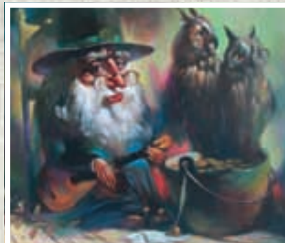
Сказочник. Холст, масло.