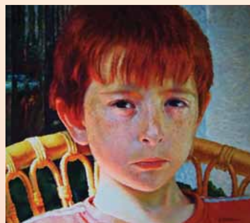
▲ Роберт Холст, масло, 2010, 95x75 см