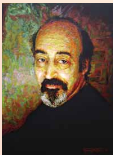
▲ Портрет брата Холст, масло, 2011, 60x45 см