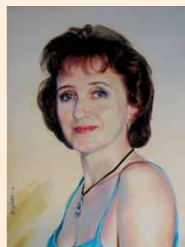
▲ Тамара Холст, масло, 2007, 68x48 см